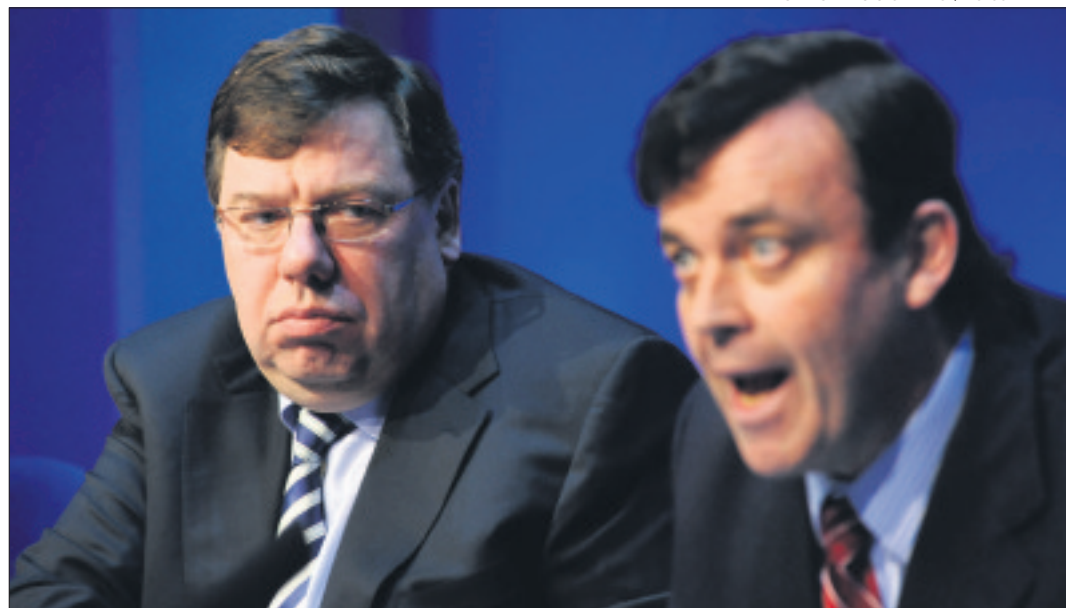
An Taoiseach Brian Cowen ag éisteacht leis an Aire Airgeadais Brian Lenihan ag ócáid seolta an Réamhthuarascáil ar an nGéarchéim Baincúireachta ag Tithe an Rialtais.